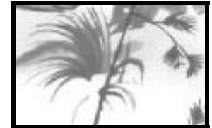
la touffe d'herbe