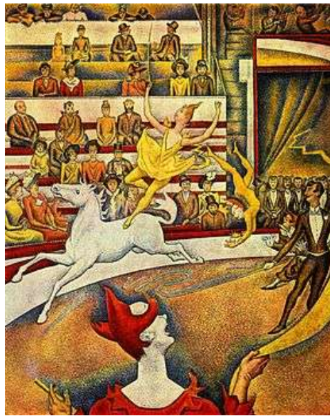
Le Cirque ou Cirque 1 est un tableau de Georges Seurat