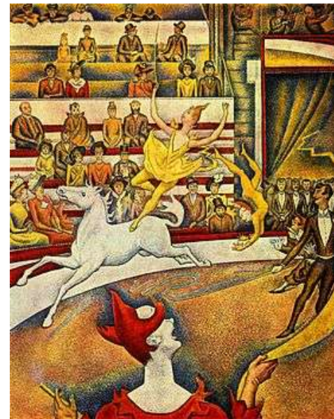
Le Cirque ou Cirque 1 est un tableau de Georges Seurat