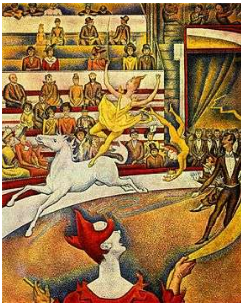
Le Cirque ou Cirque 1 est un tableau de Georges Seurat